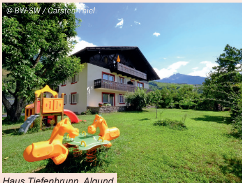
Haus Tiefenbrunn, Algend