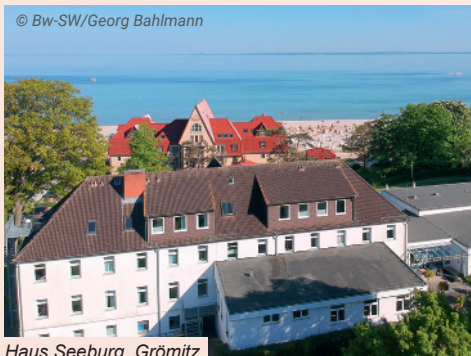
Haus Seeburg, Grömitz