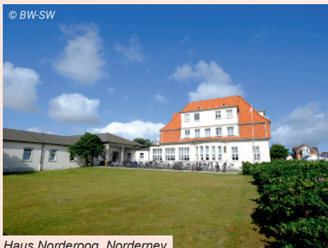
Haus Norderoog, Norderney