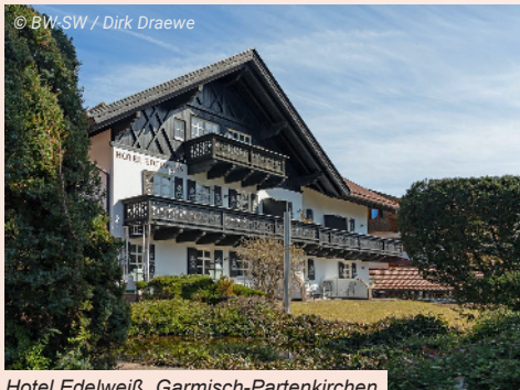
Hotel Edelweiß, Garmisch-Partenkirchen